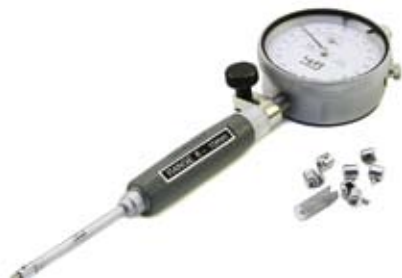
Нутромер повышенной точности

Большое количество инструмента на складах, налаженные связи с другими производителями и поставщиками, квалифицированный персонал позволяют ООО «УралИнструментИмпЭкс» обеспечить надежную и своевременную поставку широкого ассортимента промышленного инструмента