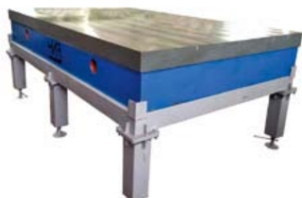
Плита 2 500 x 1 600 на подставке